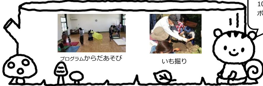
プログラムからだあそび